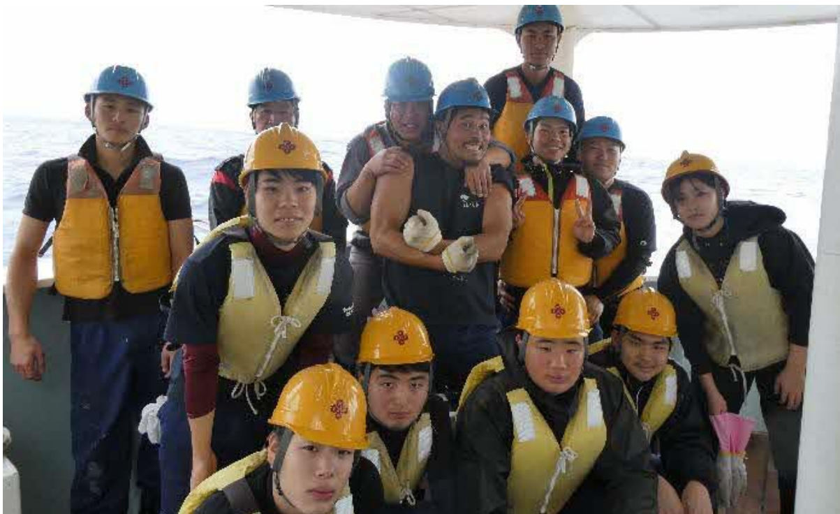
写真の乗組員さんと生徒との投縄はきょうが最後となりました。 記念撮影！！ みんないい顔しています！！ 明日はいよいよ千秋楽です！！