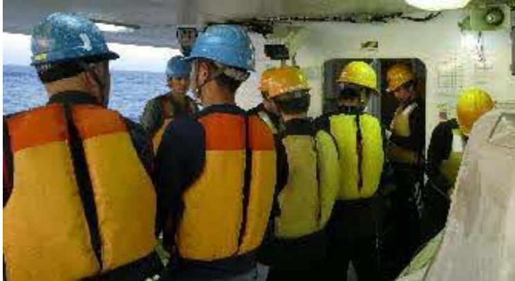
乗組員と実習生が並んで作業を進めます！！

操業実習も残り2回となりました。あっという間ですね。生徒たちにとって良い経験になったと思います。12回目の投縄の様子をお伝えします。