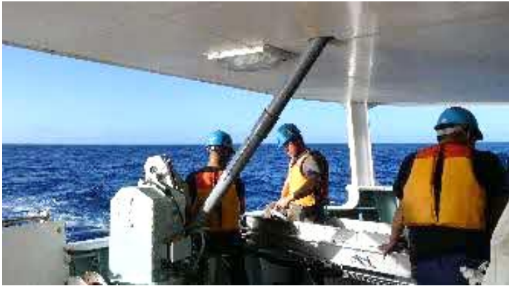
日が昇ると、快晴。波も穏やか、南太平洋！