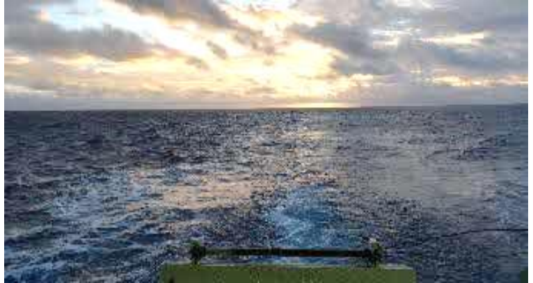
投縄作業中に見る朝日。とてもきれいです。