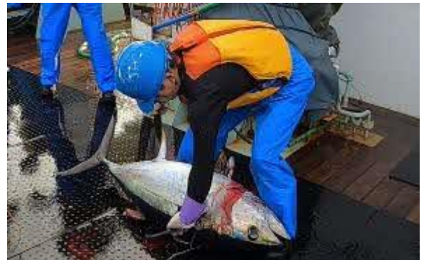
今日は大きめのメバチもかかりました！！