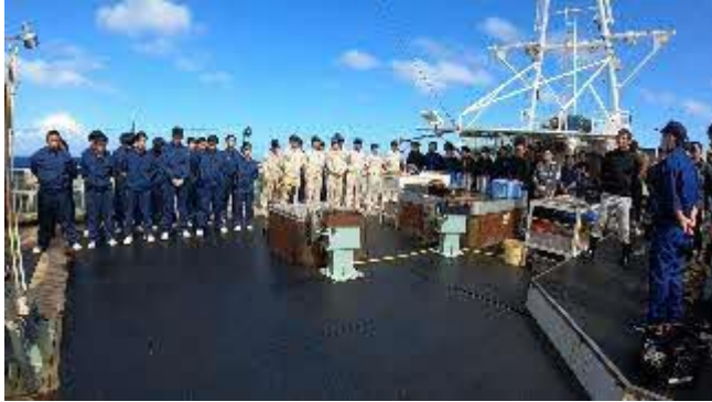
海の安全祈念日の様子

実習生は皆元気です。ああ！オッチョコチョイはおります。海・空はご覧のとおり、時々スコールがきますがそれも気持ちよく感じます。