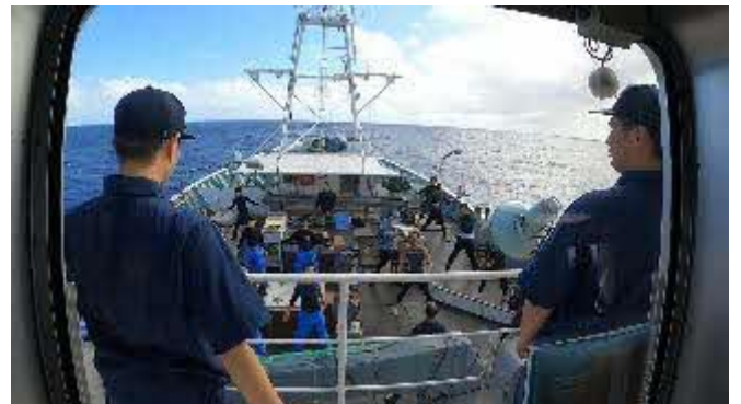
さ〜て！これから揚げ縄 その前にラジオ体操！