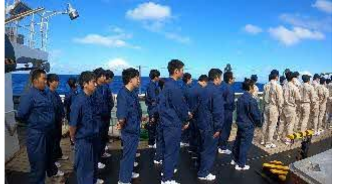
海の安全祈念日の様子