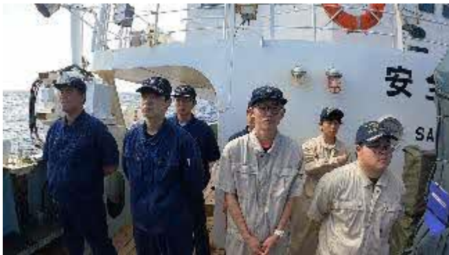
海の安全祈念日の様子