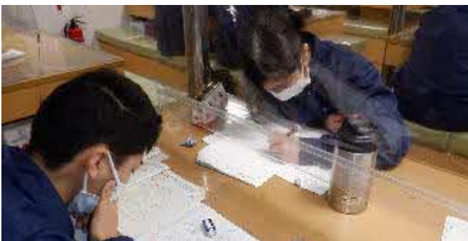
Tコースは、船内で自主学习です。