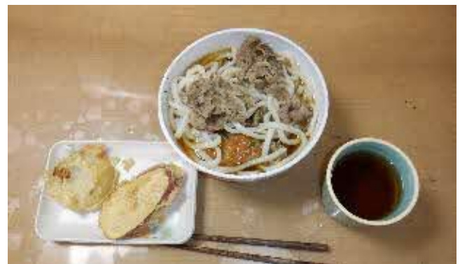
本日の昼食は肉うどんと玉ねぎ、薩摩芋の天ぷらでした。毎日飽きないようにいろいろなメニューが登場してきます。それに美味しいです！