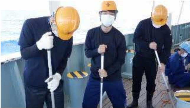
昨日と入れ替わり、Eコースが船体整備を体験しました。