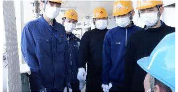
乗組員さんの指示を真剣に聞きます！