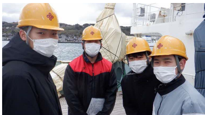
Eコースの生徒が中心になり作業をおこないます。