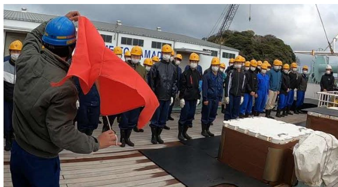
危険物積み込みにはB旗を掲げます。