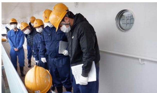
専攻科生から補油作業の説明を受けました。