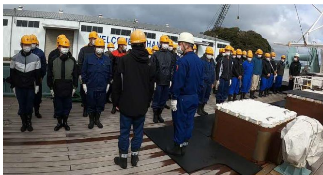
全体での安全指導