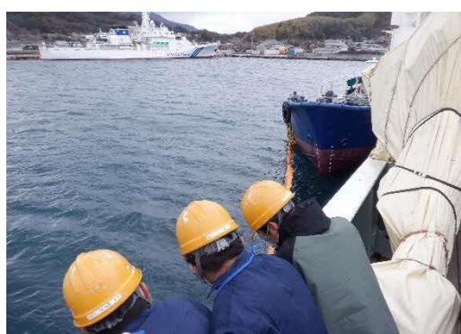
初めての経験、興味津々！