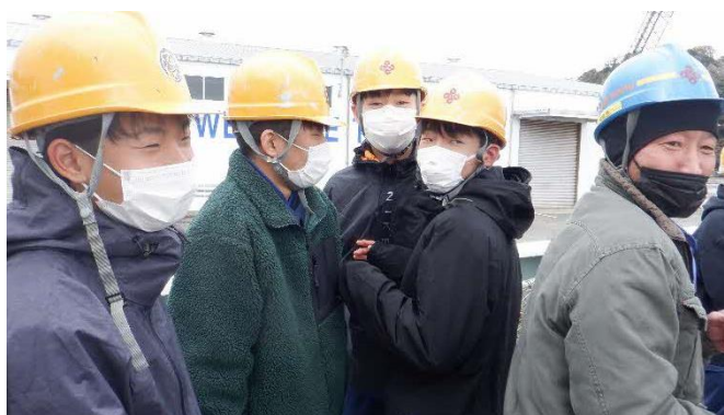
補油作業前の様子