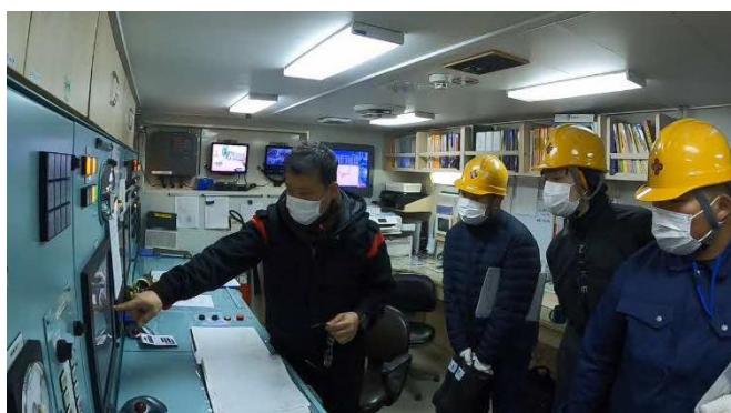
機関制御室の様子