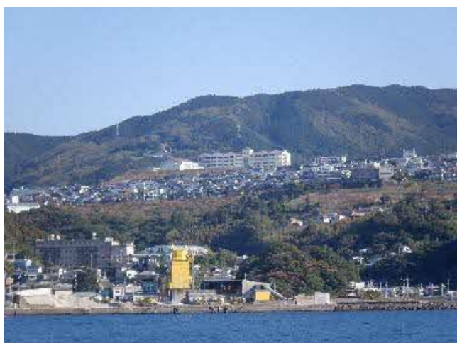
長崎は坂の街ですね！