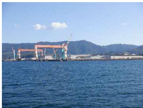
港の入口に大きなドックもあります！