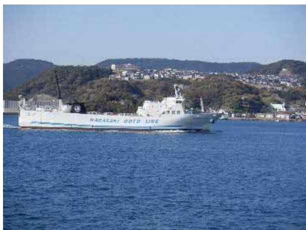
五島列島とを結ぶフェリー！

とにかく景色や街を撮りまくりました。ここで上陸と思うと・・・教官の私もうきうきしてしまいます！