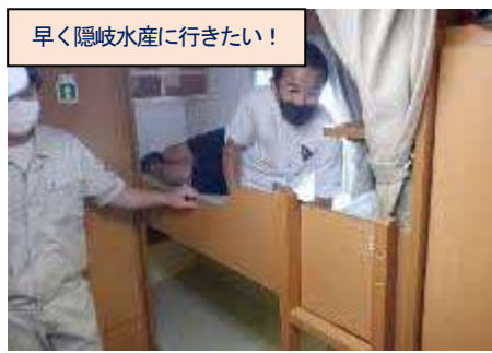
早く隠岐水産に行きたい！