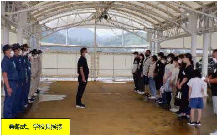
乗船式。学校長挨拶

7月10日 09:30。日曜日の朝にも関わらず神海丸に多くの人が集まる。3学期にマグロ漁業実習で神海丸に乗船する2年海洋システム科の保護者13名だ。3つに分けられた班を専攻科生2名と乗組員1名が案内した。1時間かけて「①船橋 ②機関室 ③生徒居住区」を見学した。2ヶ月半の間、自分たちの子供がここで生活する。実際に船内を見た保護者からは、いくつもの質問が出された。学校長は保護者の声に耳を傾け、率先して船内の広範囲を案内・説明した。