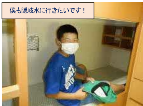
僕も隠岐水に行きたいです！