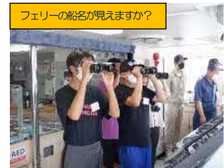
フェリーの船名が見えますか？