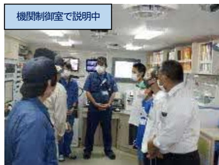
機関制御室で説明中