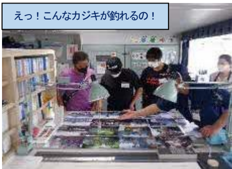
えっ！こんなカジキが釣れるの！