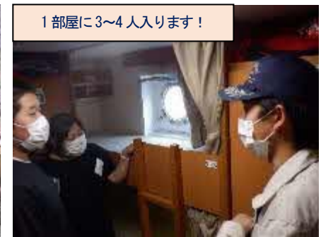
1部屋に3～4人入ります！