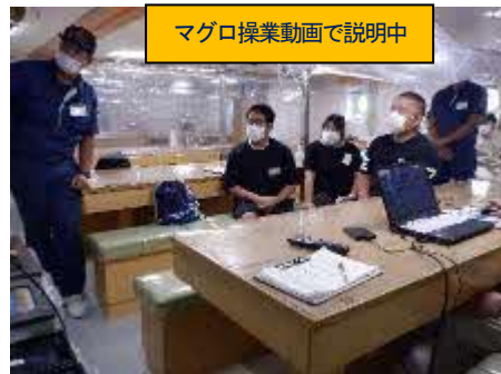
マグロ操業動画で説明中