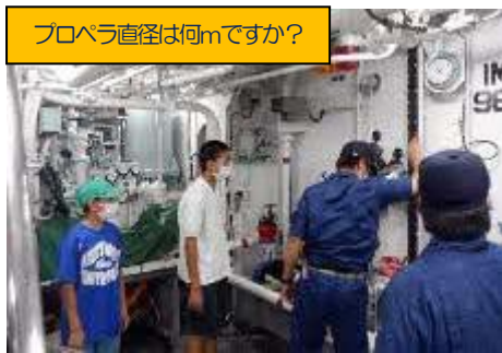
プロペラ直径は何mですか？

7月10日 12:45. 本土地区の中学生体験乗船が開始。3班に分かれ2時間にわたって船内を見学した。