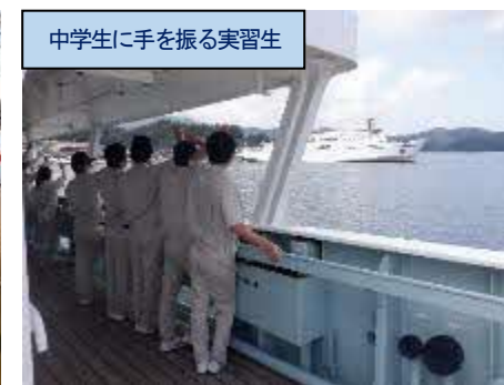
中学生に手を振る実習生