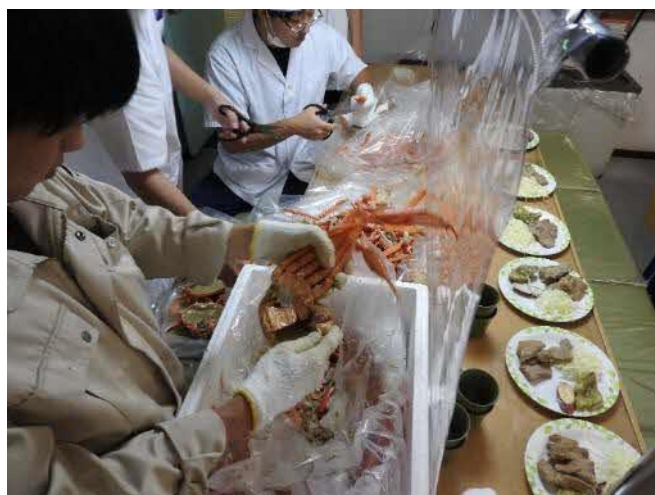
司厨部と食等担当の実習生でカニの下処理！