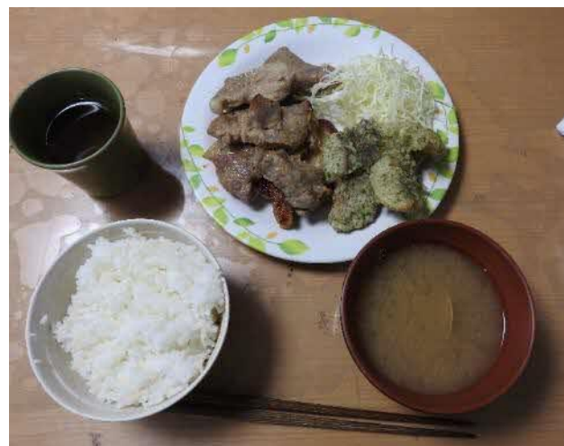
ボリュームたっぷりの夕食！