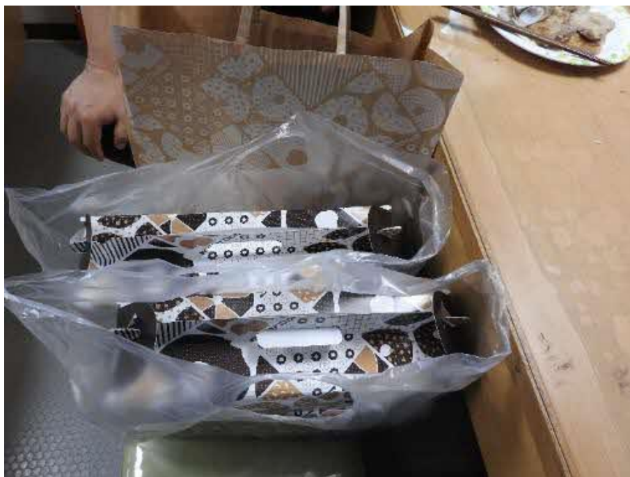
ドーナツの差し入れをいただきました！