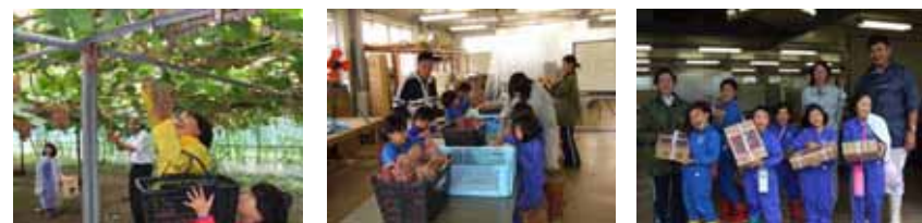
顔よりも大きいブドウにビックリしながら夢中で収穫した後、真剣な表情で調整・バック詰めを行いました。楽しい体験となったようです。

試食タイムでは、おなか一杯になるまで食べ、とても楽しい地域交流となったようでした。