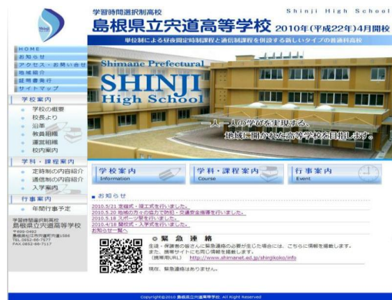
【ホームページのトップ画面】

情報セキュリティの確保については、校務用PCの業者による定期保守点検、パターンファイルの定期更新とウィルス侵入の監視（サーバーに手動チェックを入れる（週1回））、原則USBメモリ等の使用禁止（私物USB使用禁止、学校からUSBメモリの貸し出し）、個人PCの画面ロック（15分間）、校内LANの共通ドライブの再編とアクセス制限を行うとともに電子情報安全対策実施マニュアルを作成し電子情報の安全管理に関する研修会を実施した。