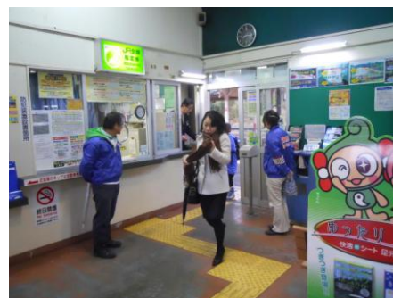
【宍道駅でのあいさつ運動】

夏休みを終え、落ち着きを見せた生徒に対して、継続的に駅のあいさつ運動や校内巡視を通して、「生徒が公共の場でのルールやマナーを守り、互いに気持ちよく行動できるようにすること」を目指し、9月から「宍道高校マナーアップ指導」と称して、これまでの立ち番指導計画にあいさつ運動を加えて再開した。当初は、あいさつを返す生徒が少なかったが、12月を過ぎる頃には徐々に増え、地元の方々からも「宍道高生はあいさつをしてくれます。」という声が聞かれるようになってきた。このマナーアップ指導は現在も行っている。将来的には、このあいさつ運動を生徒会との合同活動として継続させたい。