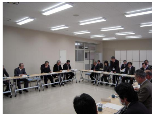
【地域連絡協議会の様子】

上記の目的で昨年7月、「地域連絡協議会」が、本校で開催された。この会は学校関係者、地元の公民館、自治会、宍道駅や駐在所など概ね15名程度で構成されており、年2回(7月、2月)開催し、情報交換をとおして、本校の教育や生徒がかかえる諸問題への協力体制づくりに一役か