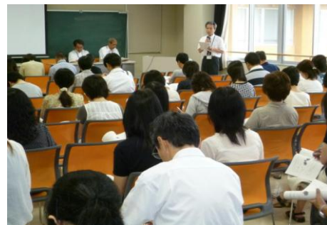
【F T A総会の様子】

平成22年度の活動については、7月に総会を行い組織として立ち上がったばかりであるものの、学園祭での「フリーマーケット」への協力とその売上金を地元の社会福祉協議会へ寄付する活動を行うことができた。来年度の活動については、研修会や各委員会での活動を視野に検討を行っている。