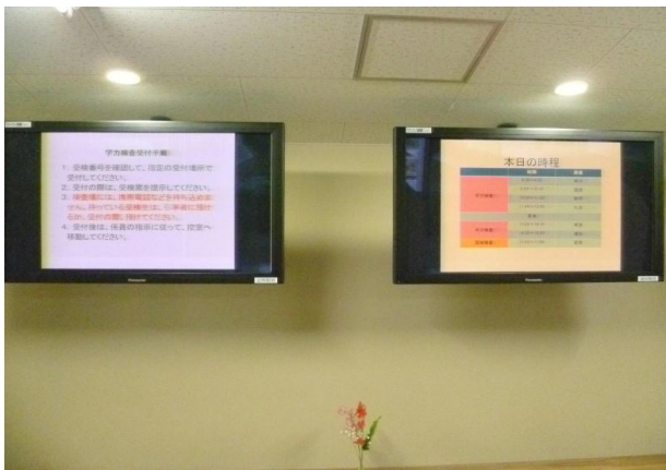
【電子掲示板システム】

次に電子掲示板システム、HPの有効活用について説明する。各分掌と連携した情報管理として、多目的ホール前と職員室内に設置された電子掲示板システムの有効利用、HPの活用とタイムリーな情報の更新を行った。電子掲示板システムの通常運転は自動スケジュール（毎日 7:30~21:30、定時制は月~金、通信制は日、月、金）で、画面構成は自由に設定できる。現在は、利便性を考慮して『3画面（メイン画像〔ワード、エクセル、パワーポイントで作成した文書を20秒で切り替えて表示〕、サブ画像〔月間行事予定を標準とする〕、テロップ〔文字が右から左に流れる〕）』で運用している。HPは学校や各分掌からの情報発信並びに学校の活動の様子などを定期的に更新した。また緊急連絡情報をHP上に掲示し、携帯サイトのQRコードからアクセスできるようにした。