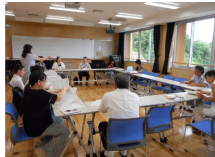
【生徒理解のための教職員研修】