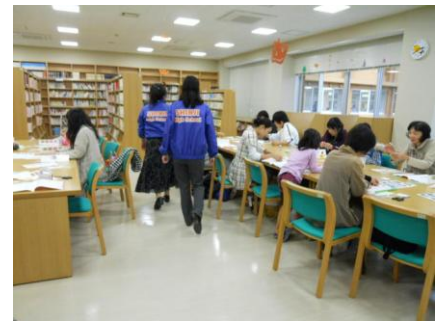
【エコバック作りの様子】

学園祭では、『絵本カバーでエコバッグ作り』を行った。10月30日に図書館内で2回行ったが、1回目15名、2回目17名の参加があり、うち、生徒以外の一般客が16名であった。