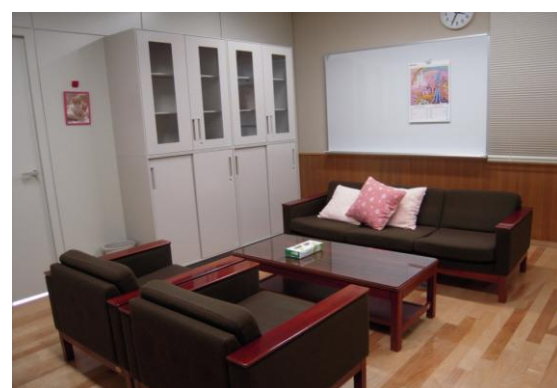
【カウンセリングルームの様子】