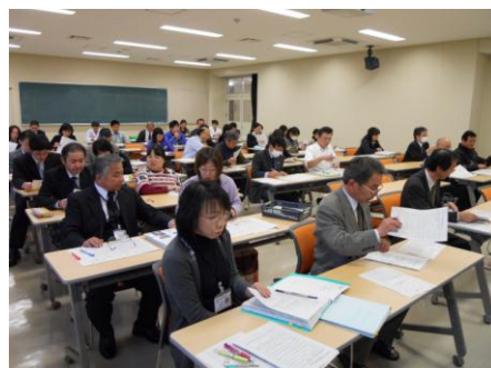
【特別支援教育に関わる教職員研修】