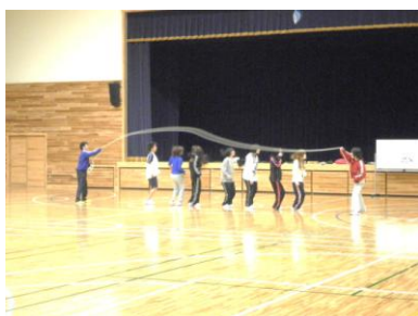
「体育の授業風景」（おおなわ飛び：みんな頑張りました！ 拍手!!）