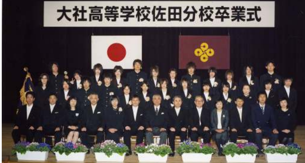
大社高等学校佐田分校卒業式