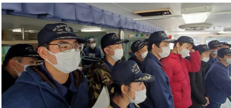
航海当直について（ブリッジ）