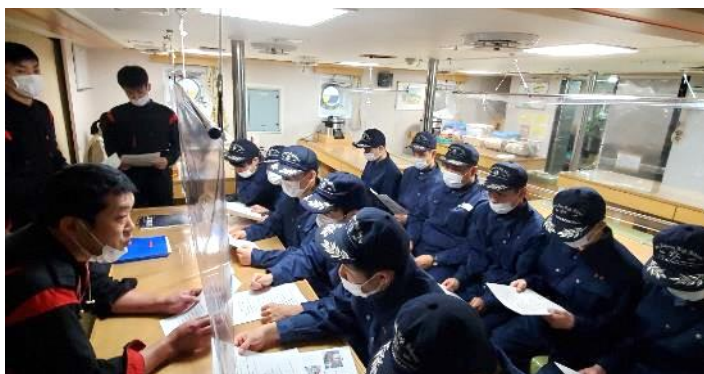
乗組員から作業内容の説明