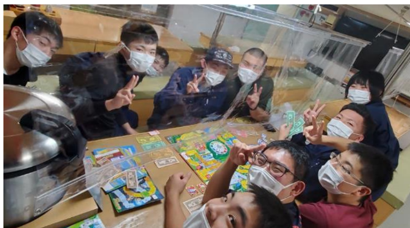
自由時間（なぜか人生ゲーム）