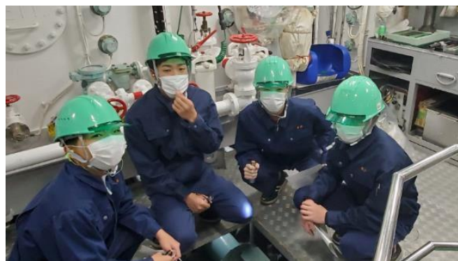
機関室後部 減速機付近で