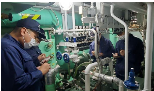
冷凍機の取り扱い