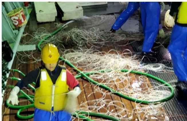
枝縄：幹縄につけるマグロ針が付いたロープ