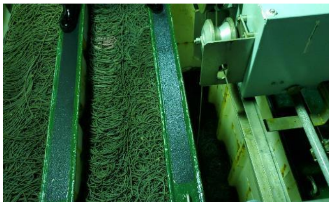
幹縄タンク（約70km海へ流すマグロ縄が格納されています！）