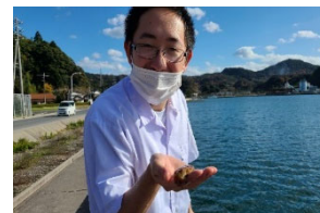
時には他コースのお手伝いも・・・ 手には親指サイズのイカが・・・