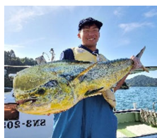
ビッグワングット！