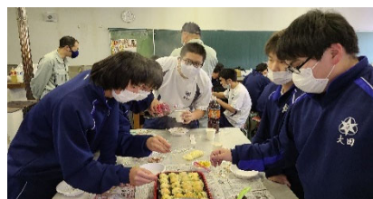
二学期最後の実習 最後は皆で楽しくタコ焼きで✕