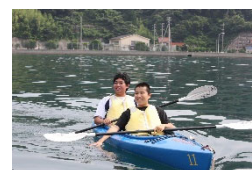
マリンスポーツで カヤック漕艇