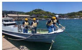
タコツボ出港の様子 果たして結果は！？