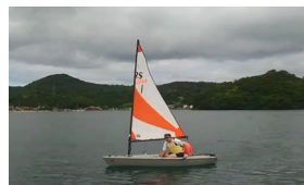
ヨットを用いた実習 華麗なターン！！