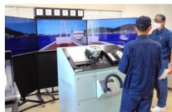
操船シミュレータ