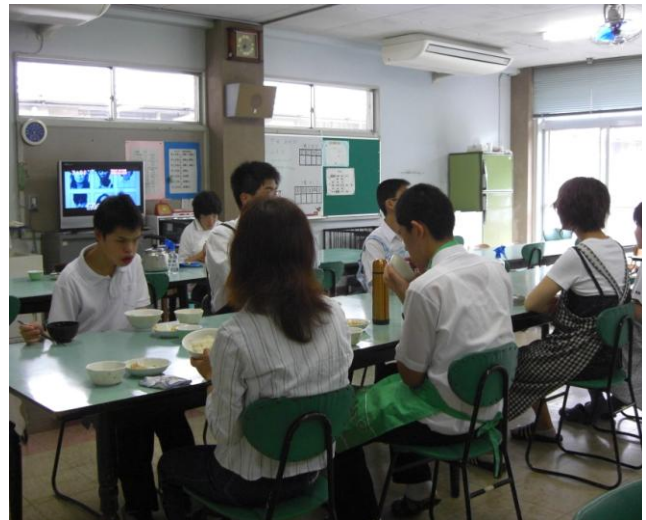
寄宿舎食堂での食事