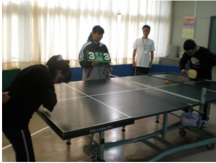
サウンドテーブルテニス（STT）

部活動は、運動部と音楽部があり、運動部は、中国・四国地区盲学校体育大会（卓球、サウンドテーブルテニスなど）や、鳥取・岡山・島根の盲学校が集まって行う親善卓球大会にも出場しています。