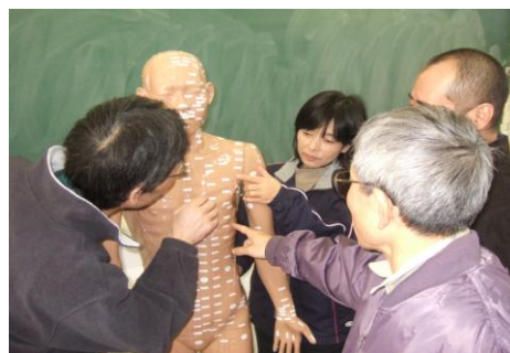
基礎理療学(経絡経穴概論)の授業