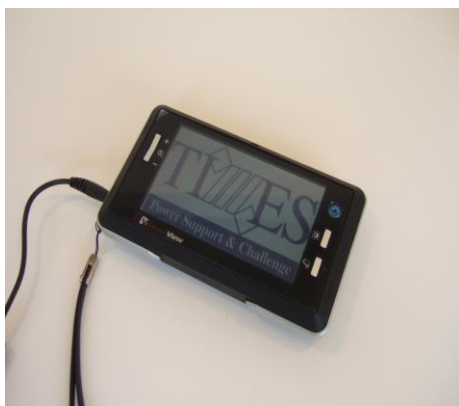
携帯用 拡大読書器