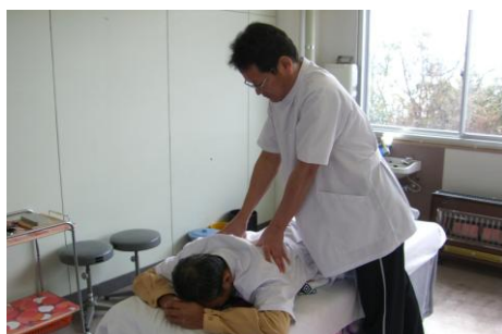
基礎実習(あん摩実習)授業

1年次履修科目…科学的思考の基盤、人間と生活、人体の構造と機能、疾病の成り立ちと予防、保健理療基礎実習など