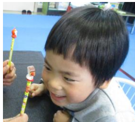
両眼の動きを観察