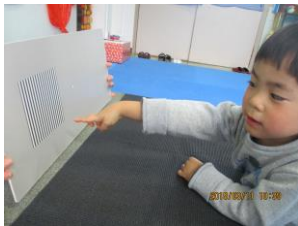
TAC (縞視標) による 視力評価